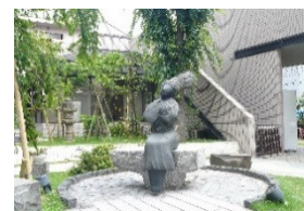
シンボル像ふくちゃん