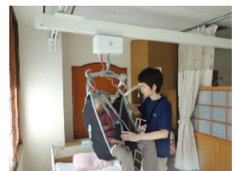
介護リフトによる車椅子への移乗