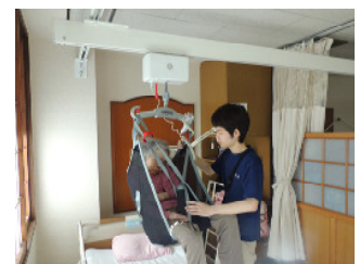
介護リフトによる車椅子への移乗