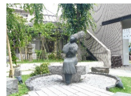
シンボル像ふくちゃん