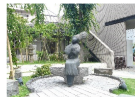
シンボル像ふくちゃん